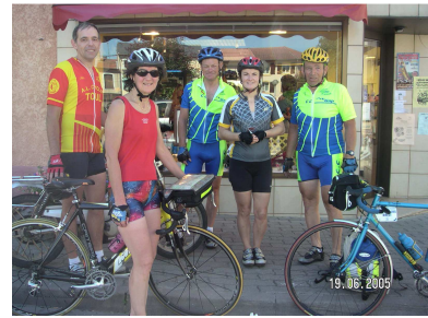
Rencontre à Bayon

Etablissement de bon aloi et escale réparatrice dans un secteur où le séjour de Napoléon constitue un fort argument touristique.