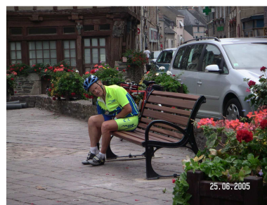
Massage d'orteils à Malestroit

D'un prix raisonnable les hôtels de cette chaîne servent les repas jusqu'à 22h00. Leur handicap réside dans la difficulté à les localiser dans les zones d'activités, facile en voiture, pas toujours évident en vélo.