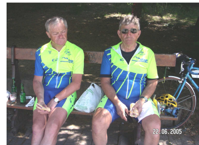
Casse croûte à Carhaix